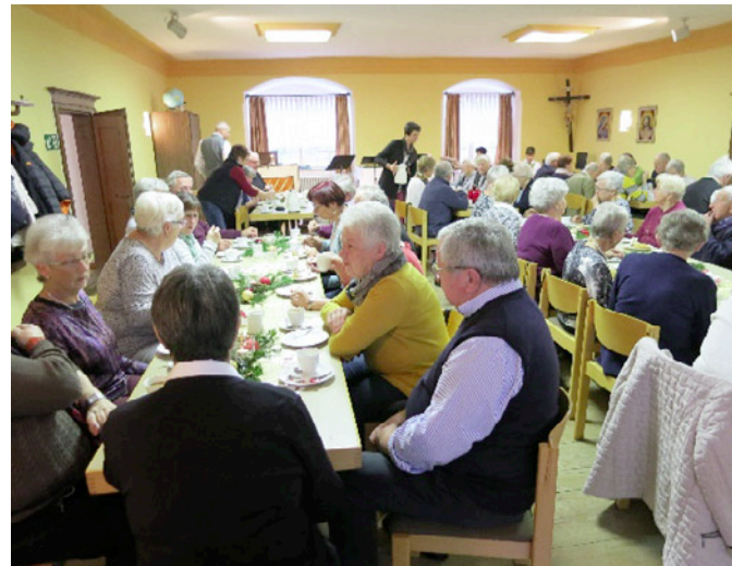
Blick in den Pfarrsaal beim Senioren-Advent